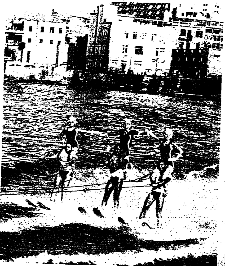
لقطة اخرى من الاستعراضات لفتيات يمسرن الورد على كتف الشباب